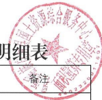
乳源县一六镇团结村委火烧岭村宅基地和集体建设用地房地一体确权登记调查结果及首次登记公示明细表