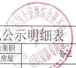
乳源县乳城镇新民村委扁山村宅基地和集体建设用地房地一体确权登记调查结果及首次登记公示明细表